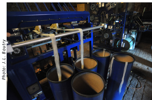
La cardeuse et ses rubans de laine

Avant de passer par toutes ces étapes « machines », la laine sera triée, lavée puis séchée naturellement. Lors de ces premières étapes, environ 50 % de la toison fournie sera éliminée.